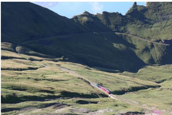
Vereinsreise aufs Briener Rothorn 16.08.18