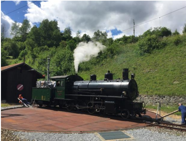
Charterfahrt, betreut durch Mitglieder unseres Vereins am 14.06.18