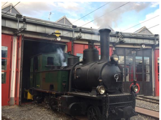
Ein letztes Mal vor der Revision stieg Rauch aus dem Kamin der Rhætia, erzeugt von einer Nebelmaschine. Rollout «Kohle-Lok» am 09.11.19