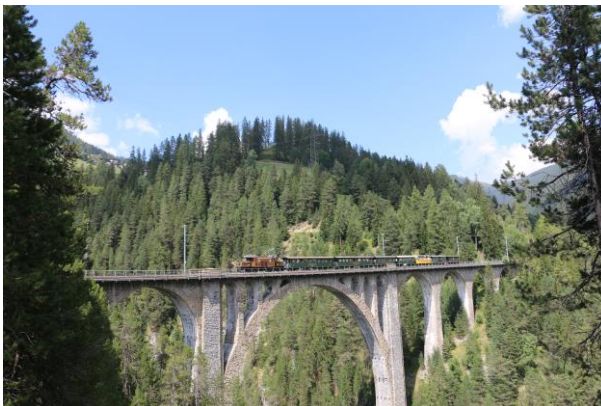
Davoserrundfahrt wegen Trockenheit mit dem Krokodil 04.08.18