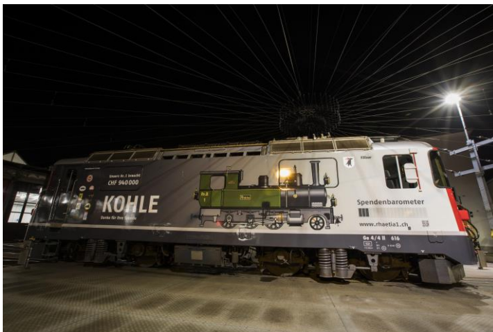
Ge 4/4 II 616 „Filisur“

1. Ausgabe 2019 (kombiniert mit der 4. Ausgabe 2018)