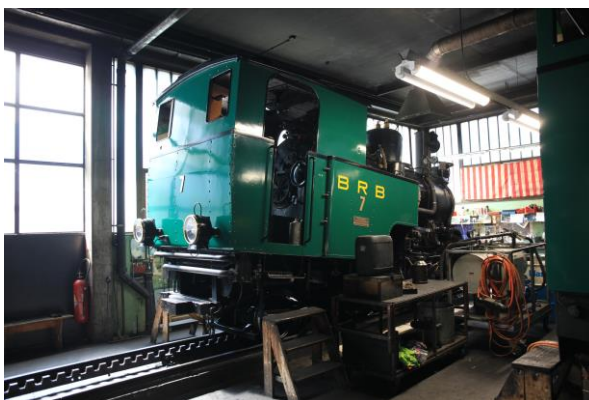
Vereinsfahrt 18./19.08.18; Bild Peter Müller