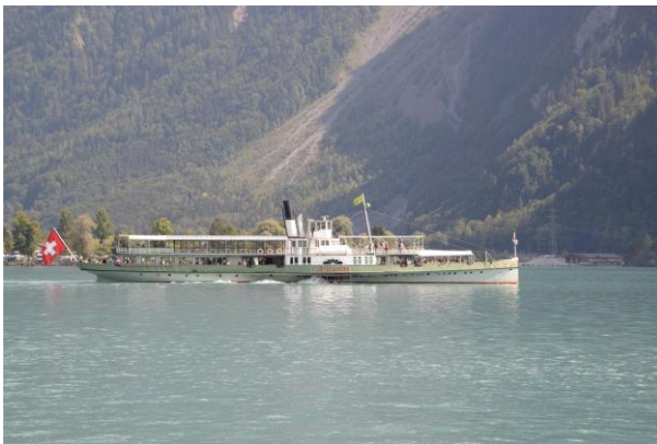
Vereinsfahrt 18./19.08.18; Bild Tobias Kaufmann