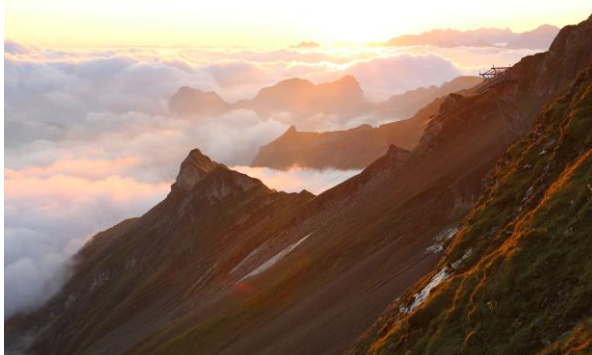
Vereinsfahrt 18./19.08.18; Bild Stefan Wyss