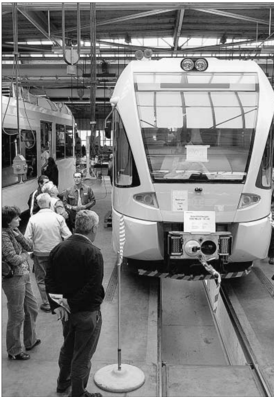
Vorgeschmack auf Athen: Besucher betrachten die «Stadler OSE-MS», die in den RhB-Werkstätten in Landquart zusammengestellt wird und an den Olympischen Sommerspielen in Griechenland zum Einsatz kommt.

Die Reise in die Zukunft dauert 15 Minuten, Abfahrt jede halbe Stunde.