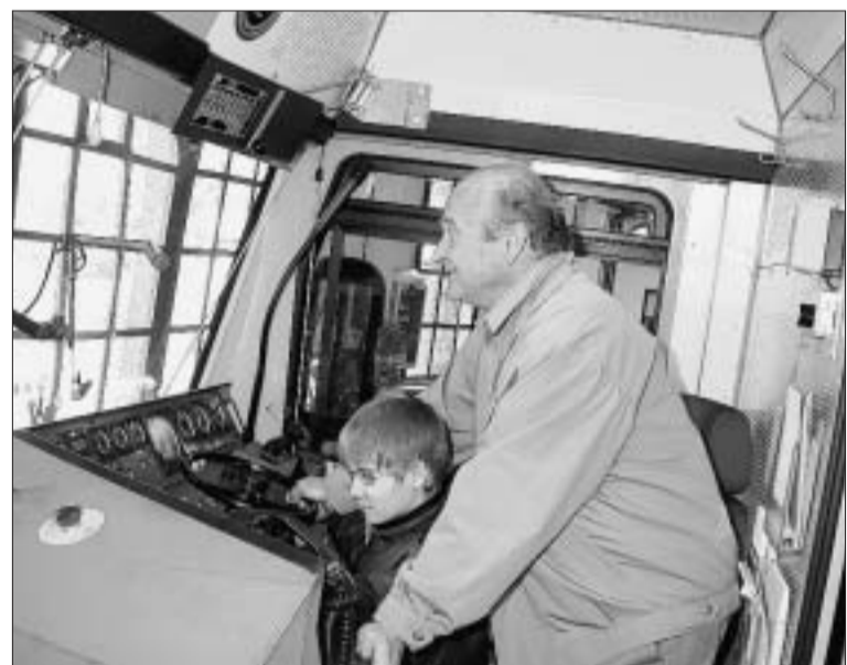
Für einmal Lokführer sein: Dieser Wunsch ist am Samstag vielen Buben (und Nenis ...) in Erfüllung gegangen.