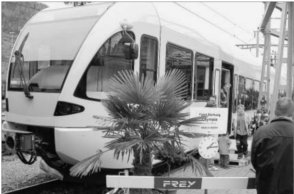
Griechisches Ambiente: Fahrt ins Blaue mit dem Olympia-Gelenktriebwagen.

Grosser Star des Tages war zweifellos der Gelenktriebwagen für die griechische Staatsbahn OSE. Der RhB-Hauptwerkstätte wurde durch die Stadler Rail Group die Endmontage und Inbetriebnahme von elf Gelenktriebwagen von Typ GTW übertragen. Der 35 Meter lange Gelenktriebwagen, diesel-elektrisch 550 kW, mit 53 Tonnen Gewicht, einer maximalen Geschwindigkeit von 100 Stunden-