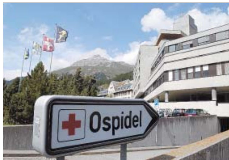
Leistungskatalog definiert: Auch im Kreisspital Oberengadin in Samedan weiss man nun, woran man ist. (tam)

Er hoffe, es sei das letzte Mal, dass er zu diesem Thema eine Medienkonferenz einberufe, sagte Regierungsrat Martin Schmid gestern bei der Präsentation der beiden Botschaften zur Neukonzeption der Spitalversorgung des Kantons und der Neugestaltung des Spitalplatzes Chur. «Und die beiden Vorlagen sind Mehrheitsfähig», gab sich der Sanitätsdirektor im Beisein seiner Kaderleute überzeugt. Der «ambitiöse Fahrplan» geht davon aus, dass die Neukonzeption